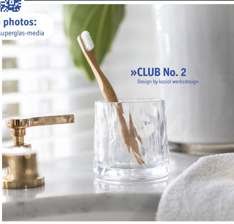
»CLUB No. 2 Design by koziol werksdesign