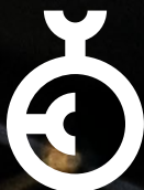
»CLUB No. 7 40ml | 3798