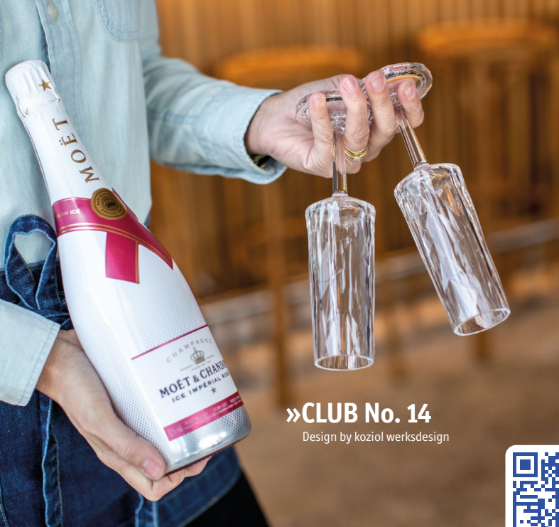
»CLUB No. 14 Design by koziol werksdesign